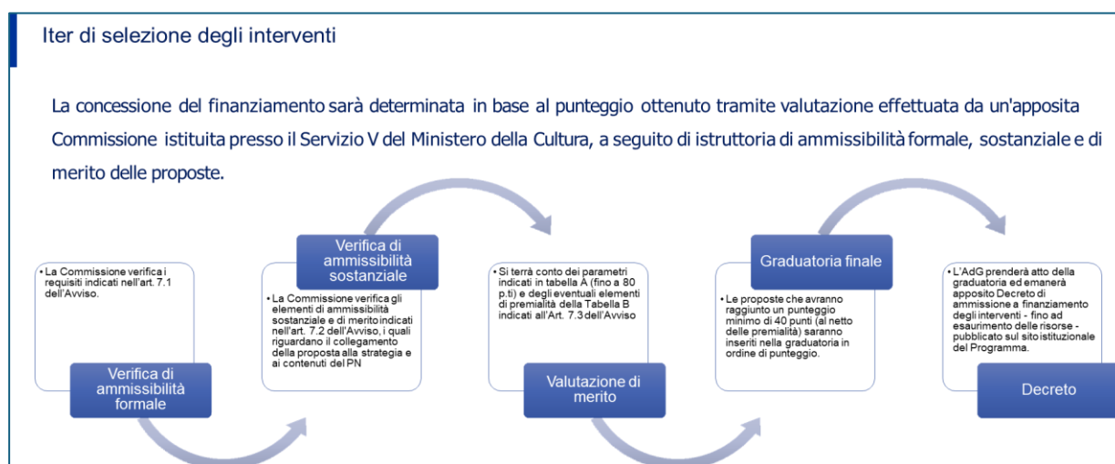
Figura 1 - Azione 2.1.1 - Step della procedura di selezione degli interventi

Tutti i principali atti della procedura, fino a quando non sarà operativo il Sistema ReGiS Coesione per il MiC, sono inclusi nella repository unica (Cloud) del PN 2021-2027 "One Drive" .